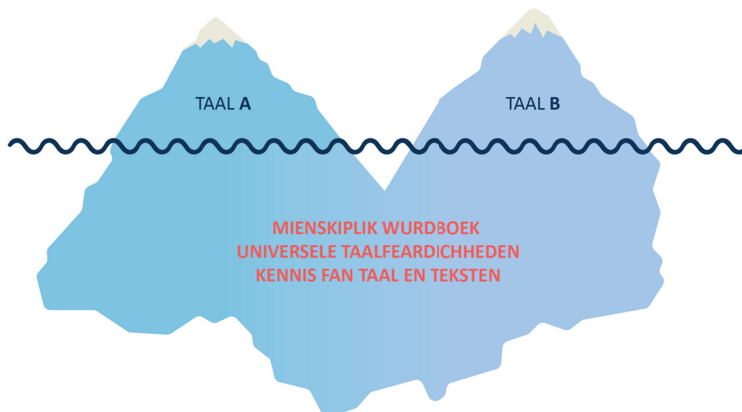
Figuur 2: De iisberg fan J.Cummins